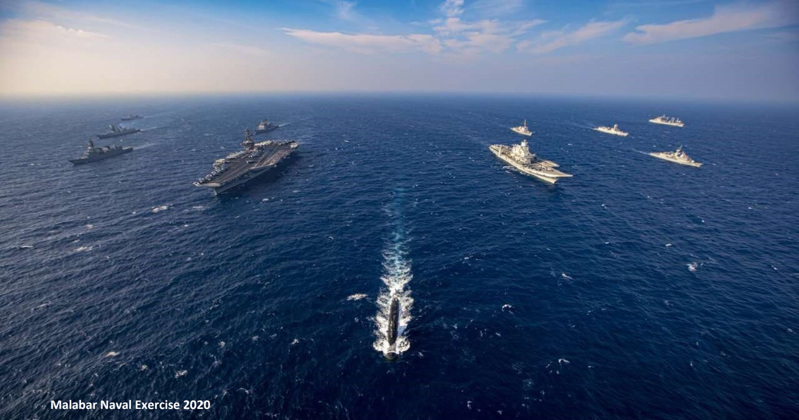
Malabar Naval Exercise 2020

Qu'il s'agisse de sa stratégie du « collier de perle » et la mise en place des différentes dimensions de ses « nouvelles routes de la soie », la Chine a avancé ses pions avec rapidité et efficacité au cours des deux dernières décennies et les réalisations concrètes de ces stratégies sont désormais visibles sur l'ensemble de l'arc IndoPacifique.