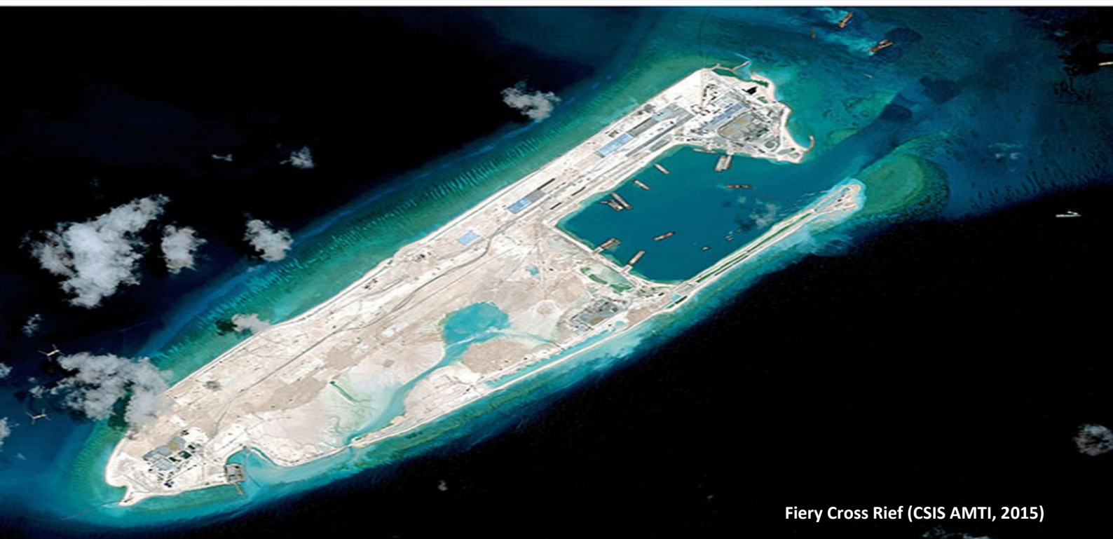
Fiery Cross Reef (CSIS AMTI, 2015)