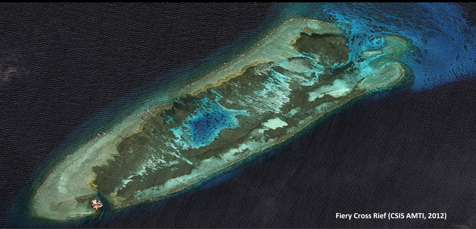
Fiery Cross Reef (CSIS AMTI, 2012)